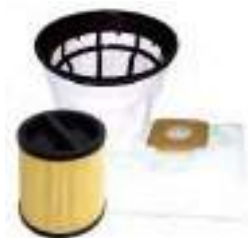
Дополнения в виде фильтра и текстильных мешков гарантируют невероятно высокий уровень фильтрации