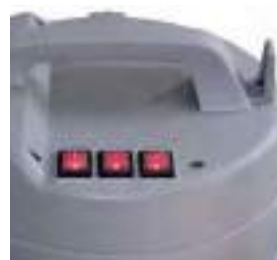
Три отдельно настраиваемые турбины для простого регулирования мощности всасывания.