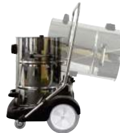
Удобная функция опрокидывания бака обеспечивает быстрое и легкое опустошение.

Высокопроизводительный пылесос для обслуживания промышленных объектов и индустрии общественного питания. Профессиональный пылесос, оснащен фильтром для мелкодисперсной пыли, текстильным мешком и дополнительными аксессуарами. Высокая производительность и легкость адаптации благодаря трем отдельно регулируемым турбинам. N77/3 E - невероятно надежный пылесос для влажной и сухой уборки, и предназначенный для интенсивного использования. Удобная функция опрокидывания позволяет опустошать бак легко и быстро. Прочное шасси с поворотными роликами и большими прорезиненными колесами обеспечивают бесперебойную работу, даже на деликатных поверхностях. Возможна установка сквиджа 650 мм.