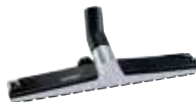
Аксессуары: металлическая насадка для сбора жидкой грязи 450 мм, Арт. № 102.051