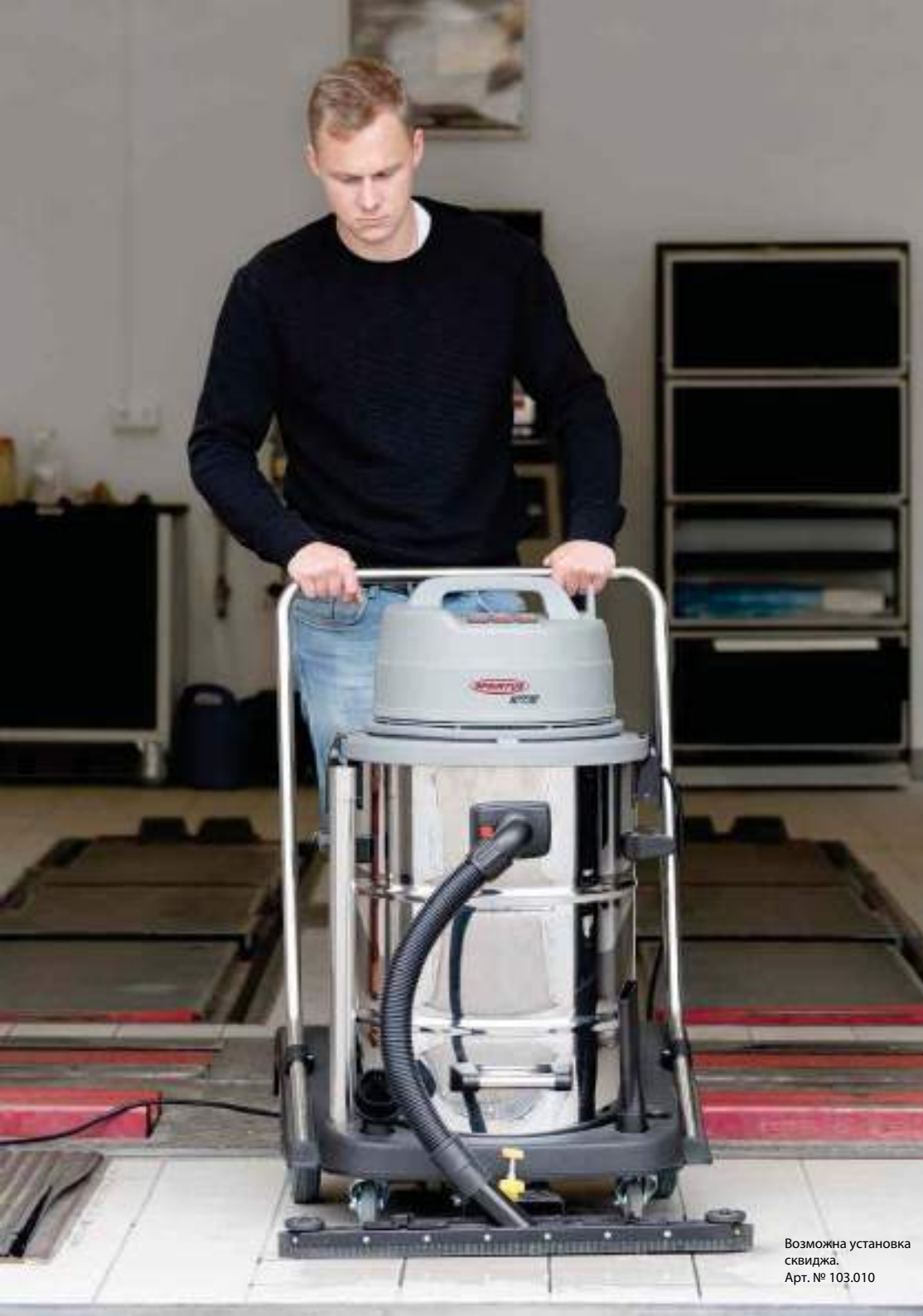
Возможна установка сквиджа. Арт. № 103.010