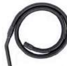
Электропроводящий шланг обеспечивает оптимальную разрядку через заземленный корпус. Аксессуары: Антистатический всасывающий шланг 3 м в сборе. Арт. № 102.116