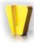
SC Желтый система крепления «ScanOn»

Инструмент используется как дополнительный шаг в технологии получения гладкого бетонного пола, чтобы уменьшить расход пластикового инструмента для полировки. SC Желтый также используется для шлифования природного камня, как сухого так и с водой.