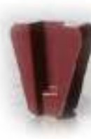
SC Коричневый система крепления «ScanOn»

Это средней абразивности инструмент мы предлагаем в небольшом выборе от шлифовки средней грубости до тонкой, мелкой.