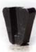
SC Черный система крепления «ScanOn»

Инструмент с алмазами грубого дробления для грубого шлифования поверхности. Используется для обработки пола перед тем как покрыть поверхность шпатлевкой, термореактивным покрытием, плиткой и т.д.