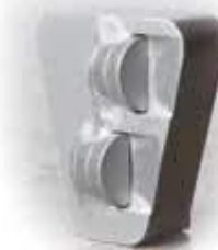
Tiger Серебряный система крепления «Scan On»

Инструмент для удаления покрытий толщиной 1-2 мм. Можно комбинировать этот инструмент со шлифовальным инструментом типа SCXXX Черный или Синий чтобы уменьшить давление на поверхность и получить шлифовальный эффект во время удаления покрытия.