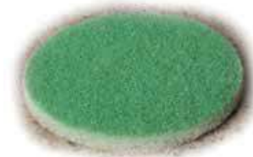
ScanPad Dancer № 4 Зеленый

ScanPad Dancer это круги с алмазным напылением.