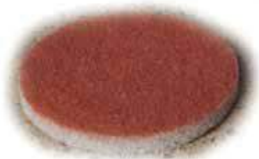
ScanPad Dancer № 1 Красный (Самый грубый)