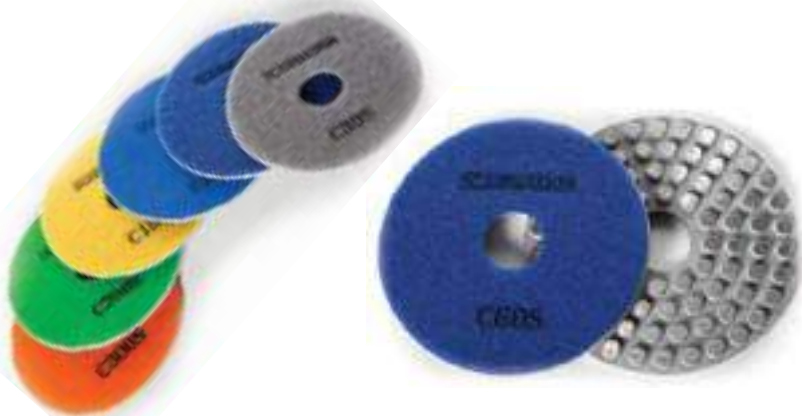
Elastic metal 125

Эффективный и износостойкий шлифовальный круг для грубого шлифования.