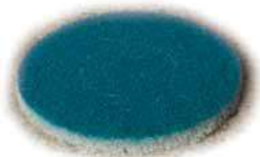
ScanPad Dancer № 2 Синий