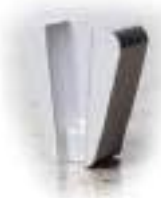
SC Серебряный система крепления «ScanOn»

Инструмент с алмазами очень крупного дробления для грубой шлифовки поверхности которая должна быть очищена от заливной корки или другого покрытия.