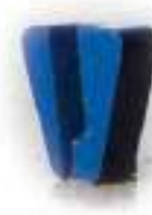
SC Синий система крепления «ScanOn»

Инструмент для тонкого шлифования перед покраской или организацией тонких покрытий.