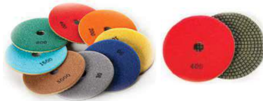
Poler pads 125

Инструмент применяется на тонких покрытиях или при полировке бетона, мозаики и природных камней, для того чтобы избежать появления шлифовальных кольцевых царапин.