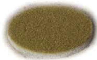
ScanPad Dancer № 3 Желтый