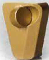
Tiger Золотой система крепления «Scan On»

Инструмент используется для удаления покрытий. Вы можете комбинировать этот инструмент со шлифовальным инструментом типа SCXXX Черный или Синий, чтобы уменьшить давление на поверхность и получить шлифовальный эффект во время удаления покрытия.