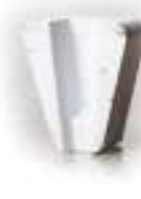
SC Белый система крепления «ScanOn»

Инструмент оставляет за собой очень гладкую поверхность. Мы рекомендуем применять SC Белый во втором шаге технологии получения гладкого пола после SC Зеленый. SC Белый также используется для шлифования природного камня, как сухого так и с водой.