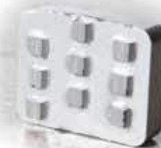
Piranha система крепления «Scan On»

Очень полезный инструмент для удаления тонкого покрытия с бетонных поверхностей. Хорошо удаляет краску, клей, остатки ковров и т.д. Piranha удаляет покрытия с бетона или камня с минимальным механическим воздействием на поверхность. Обратите внимание на то, что пористая, "мягкая" поверхность бетонных полов может повредить инструмент.