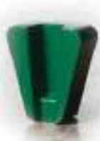
SC Зеленый система крепления «ScanOn»

Инструмент оставляет за собой гладкую поверхность. SC Зеленый используют для шлифования перед нанесением лака или тонкого защитного слоя, а также это первый шаг в технологии получения гладкого бетонного пола.