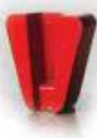
SC Красный система крепления «ScanOn»

Шлифовальная операция тонкой обработки. Инструмент применяют между Зеленым и Белым в технологии получения гладкого бетонного пола или шлифовальный шаг для получения более гладкой поверхности при шлифовании бетона, мозаики или природного камня.