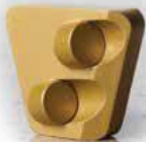
Twin Tiger система крепления «Scan On»

Инструмент для грубой обработки поверхности, удаления толстого покрытия с твердых поверхностей.