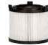
Фильтр HEPA 13, Арт. № 116.106