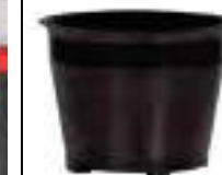
Устройство "Циклон", Арт. № 116.115

Из-за формы впускного патрубка, образующийся туман направляется к внутренней стенке бака. Больше нет необходимости в дополнительных фильтрах. Система работает даже при образовании плотной пены. Расположенные сбоку воздухозаборники охлаждения обеспечивают постоянное разделение охлаждающего и обрабатываемого воздуха.